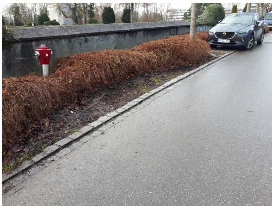
möglicher Standort 1

Der Seniorenbeirat der Marktgemeinde Dießen stellt den Antrag an die Verwaltung, dass im Bereich der Friedhöfe in Dießen und Riederau Fahrradständer (für 2-3 Fahrräder) an geeigneten Stellen aufgestellt werden.