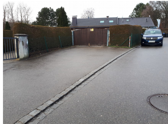
möglicher Standort 2